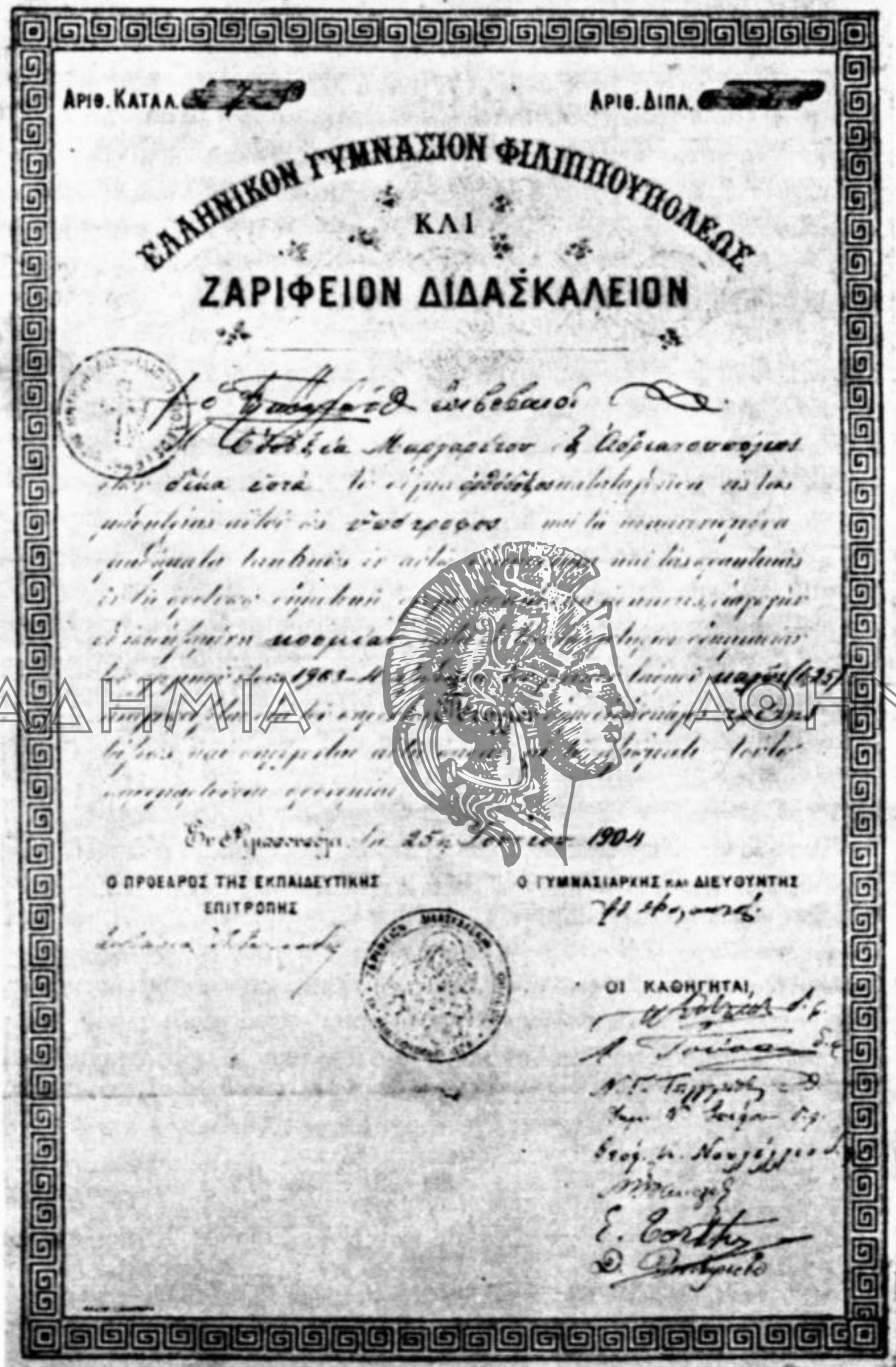
Ἀπολυτήριο τῆς Εὐδοξίας Μαργαρίτου, 1904.