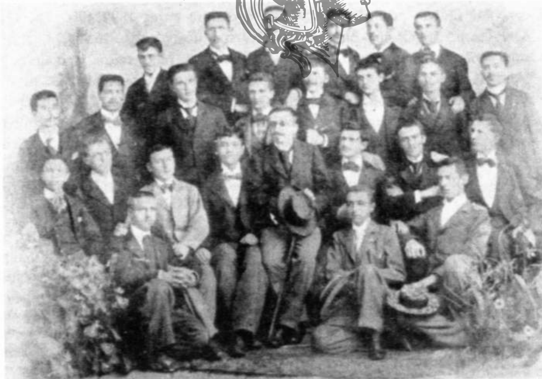
Οἱ τελειόφοιτοι τῶν Ζαριφείων Διδασκαλείων, 1903.