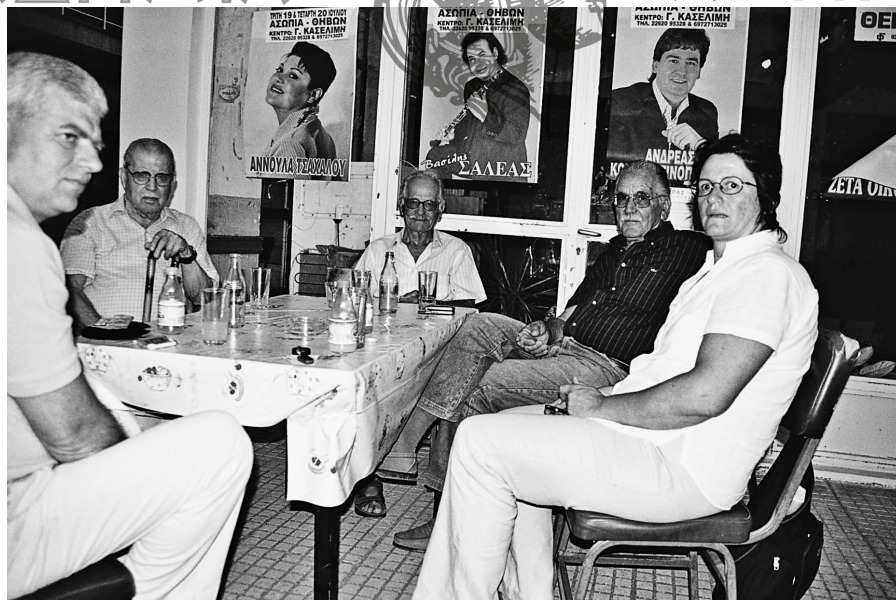
Παρέα με πληροφορητές στην πλατεία της Καλλιθέας (Βοιωτία) κατά την εντεταλμένη λαογραφική αποστολή το 2005.