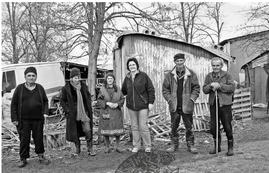
Με κτηνοτρόφους κατά την επιτόπια έρευνα στην Κοπαΐδα (Βοιωτία) το 2008.