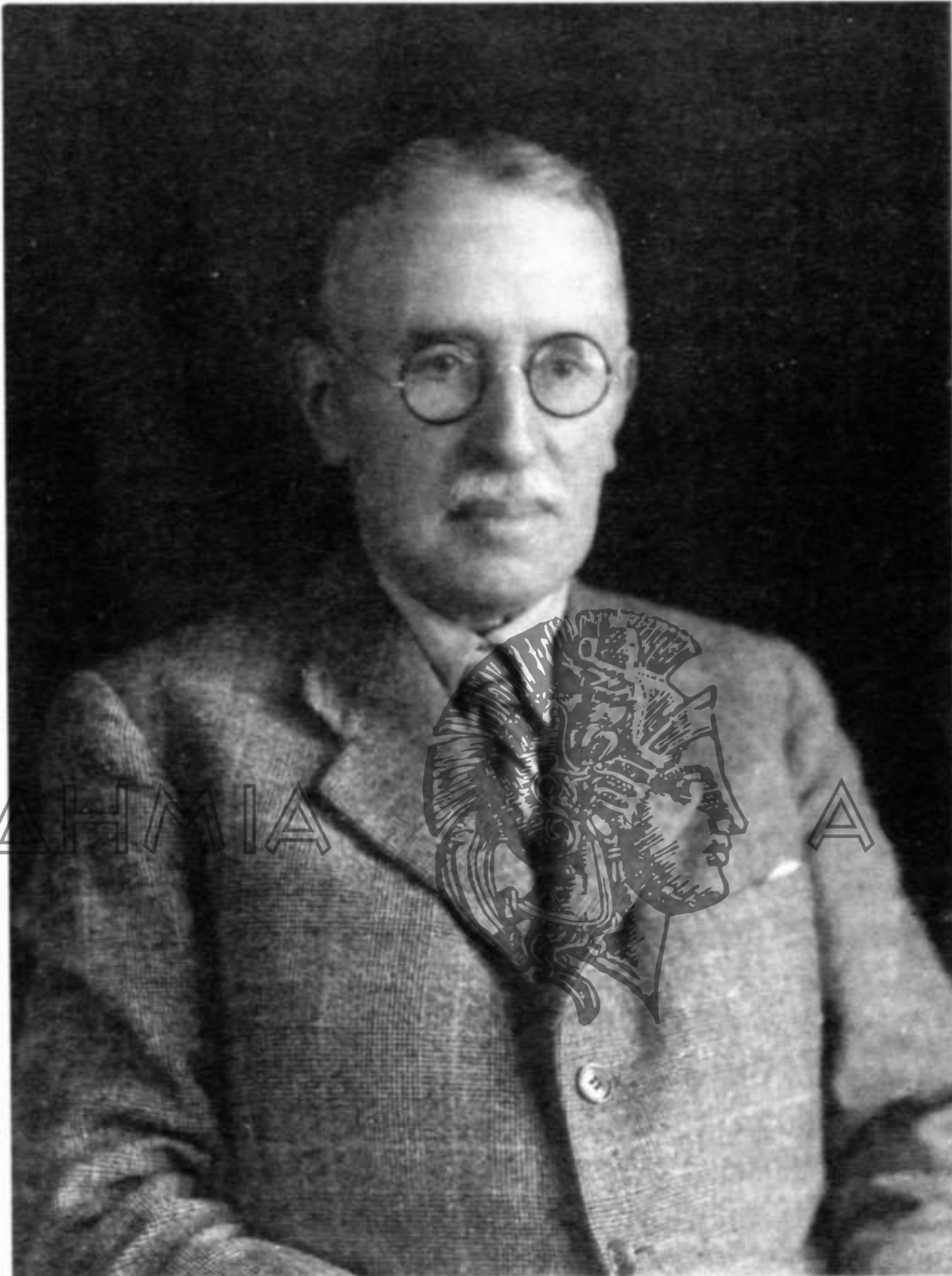
Ὁ Κωνσταντῖνος Ἀμαντὸς.