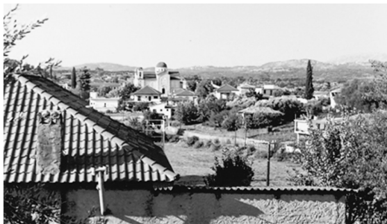
Εικ. 1. Αποψη του χωριού Μαχαιράς (επαρχία Ξηρομέρου νομού Αιτωλοακαρνανίας).