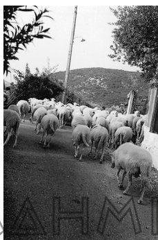
Εικ. 2. Τώρα (2009) έχουν απομείνει λίγα μικρά κοπάδια αιγοπροβάτων στην πρότερον και έξοχην κτηνοτροφική περιοχή του Ξηρομέρου (επιτόπια έρευνα 2006).