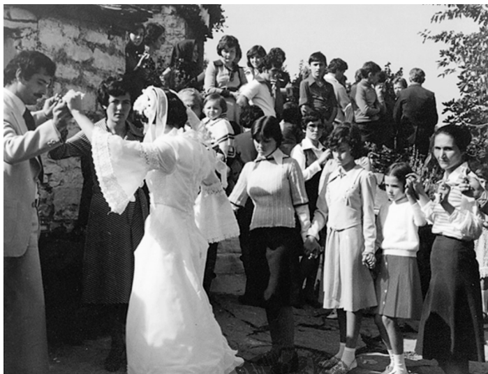
Εικ. 13. Απόλυτη προσήλωση στο γαμήλιο χορό φανερώνουν τα πρόσωπα που παρίστανται. Δεκαετία του 1970.