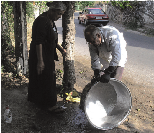
Ζευγάρι πλανόδιων γανωτήδων στο Βυζίκι. Μια τέχνη που χάθηκε μαζί με τα χάλκινα σκεύη

Ευρύτερες περιοχές όπως στην πολυτεχνική Γορτυνία με πλούτο και παράδοση τεχνικών επαγγελμάτων, αργυροχρυσοχία, ξυλογλυπτική, βυρσοδεψία, υποδηματοποιία, οικοδομική, και πολλά παραδείγματα, παραμένουν «εν δυνάμει» αναγνωρίσιμα και αξιοποιήσιμα ως πολιτιστική κληρονομιά 38 και ως οικονομικός πόρος σε μια τοπική αειφορική ανάπτυξη.