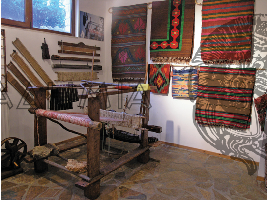
Αργαλειός και υφαντά στο λαογραφικό μουσείο στο Ράφτη

Ο ρόλος των μουσείων είναι κομβικός στη διάσωση και διάδοση των τεχνικών και της τεχνικής πολιτιστικής κληρονομιάς καθώς λειτουργούν σε τόπους οι οποίοι αναδείχθηκαν σε κέντρα μεταποιητικών δραστηριοτήτων. Η αξιοποίηση του τοπικού τεχνικού δυναμικού με συγκέντρωση πληροφοριών, οπτικο-ακουστική καταγραφή των παραδοσιακών τεχνικών -όπου ακόμα αυτές εφαρμόζονται- και κυρίως η συστηματική διοργάνωση εργαστηρίων και σεμιναρίων για εκμάθηση των τεχνικών στη νέα γενιά θα πρέπει να περιλαμβάνονται στις δράσεις ενός εθνογραφικού τεχνολογικού μουσείου.