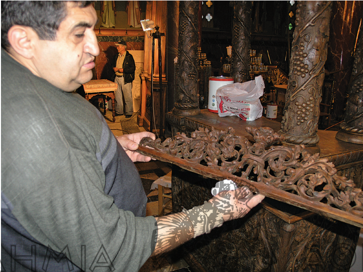
Επισκευές στο ξυλόγλυπτο τέμπλο του Γ.Ν. Αγίων Θεοδώρων στο Βαλτεσνικό, έργο των αδελφών Ντινόπουλων (μέσα 19ου αι.) (φωτ. Α. Οικονόμου 2013)

Η μαρτυρία-αφήγηση του Βαλτεσινικιώτη ξυλογλύπτη Παναγιώτη Κ. που ασκεί το επάγγελμα μέχρι σήμερα αναδεικνύει το στάδιο της μαθητείας στη σχολή ξυλογλυπτικής του ΕΟΜΜΕΧ και τις σημερινές συνθήκες άσκησης ενός παραδοσιακού τεχνικού επαγγέλματος.