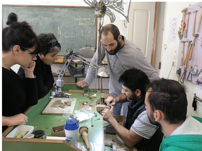
Διδάσκοντας τους μαθητές στη Σχολή αργυροχρυσοχοΐας στη Στεμνίτσα

Δεν έχουν αλλάξει. Εμείς οι τρεις προσπαθούσαμε ό τι έχουμε μάθει από τους παππούδες και εξαφανίζονται σιγά-σιγά να τα δείχνουμε στα παιδιά. Και προσπαθούσαμε να τους τα δείχνουμε και τους λέγαμε αυτό μπορεί να μη χρειαστεί να το κάνετε ποτέ, μάθετε το όμως γιατί μπορεί και να χρειαστεί. Μπορεί κάποιες τεχνικές στο μέταλλο, στο κόσμημα και να έχουν χαθεί. Σίγουρα έχουν χαθεί κάποια. Εγώ π.χ. δεν ξέρω τις αναλογίες που γίνεται το σαβάτι. Το είδα σαν μαθήτρια, το έκανα μια φορά με τον Λάμπη τον Κατσούλη όμως έμεινε εκεί. Και τώρα κανένας δεν το κάνει. Το σαβάτι είναι κάτι φοβερό για μένα, όμως δεν μπορώ να πω ότι ξέρω τις αναλογίες. Βέβαια αν μου πει κάποιος να το παλέψουμε κάτι θα βγάλουμε και με τις σημειώσεις που έχω κρατήσει. Σε ένα σχολείο οι ώρες είναι πολύ λίγες και δεν μπορείς να δώσεις τα πάντα στα παιδιά. Εγώ θεωρώ ότι το σχολείο θα πρέπει να είναι 3 και όχι 2 χρόνια και να έχει πολλές ώρες εργαστήριο». (Ε.Σ. Ζάτουνα 2013).