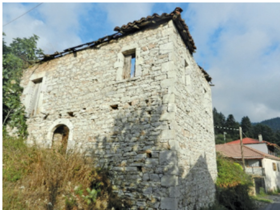
Έργο Γορτύνιων μαστόρων το πέτρινο σπίτι στη Σύρνα; (φωτ. Α. Οικονόμου, 2011)