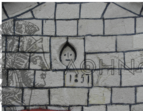
Ο Ι.Ν. Κοιμήσεως της Θεοτόκου στο Μοναστηράκι και επιγραφή, έργο τοπικών μαστόρων

Η υφαντική αποτέλεσε έναν σημαντικό τομέα της μεταποιητικής δραστηριότητας των αγροτικών κοινοτήτων με έμφυλα χαρακτηριστικά καθώς βρισκόταν αποκλειστικά στα χέρια των γυναικών και μεταβιβαζόταν από αυτές.