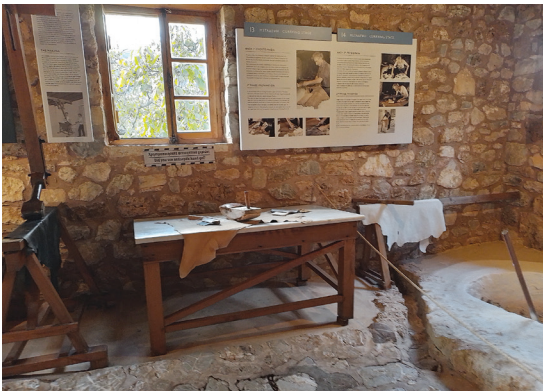
Αποψη από τα εκθέματα του βρυσοδεψείου στο Υπαίθριο Μουσείο Υδροκίνησης στη Δημητσάνα