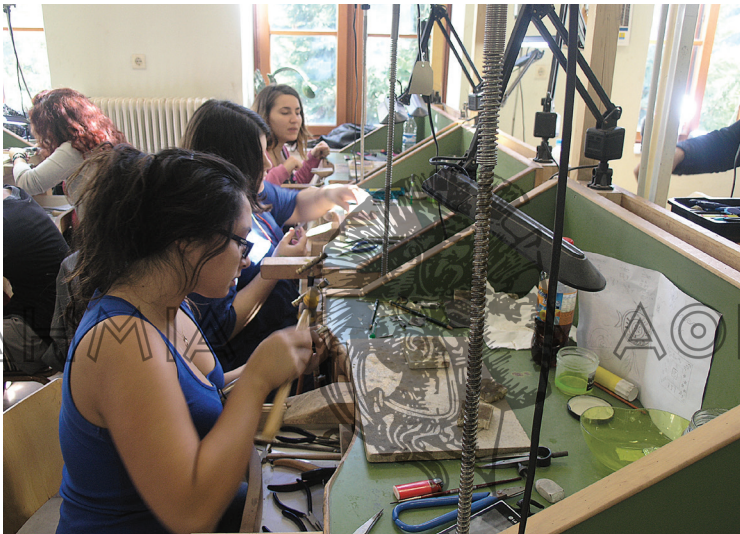
Μαθήτριες στη Σχολή αργυροχρυσοκοΐας στη Στεμνίτσα (φωτ. Α. Οικονόμου 2013)

«Ο Λάμπης Κατσούλης και ο Αριστείδης Βλαχόγιαννης έχουν πεθάνει αλλά οι υπόλοιποι στη συνέχεια όλοι είναι μαθητές τους και αυτός που έρχεται και μας κάνει μάθημα, εκτός Υπουργείου Παιδείας, και είναι φοβερός είναι ο Ντίνος Σαρακινιώτης. Είχε φύγει και γύρισε πάλι στη Στεμνίτσα. Υπάρχουν και οι Καραλήδες και άλλοι, πολλά επώνυμα Γαρταγάνηδες, Χασάπηδες που εγώ δεν τα γνωρίζω γιατί δεν είμαι από εδώ. Εκείνοι ξεκινάγανε από 13 χρονών και μάθαιναν την τέχνη. Έχουμε πάρει τα βιογραφικά τους και μας είπαν ότι στην ηλικία 13-15 χρονών πάνε στην Αθήνα σε έναν στεμνιτσιώτη αργυροχρυσοκόο και μαθαίνουν την τέχνη από μικρά. Είναι πολλοί....» (Όλγα Π., Σχολή Στεμνίτσας).