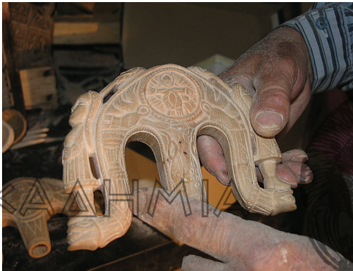
Ομοιαδικός ξυλογλύπτης στο Βαλτεσινίκο επι τῷ ἔργῳ