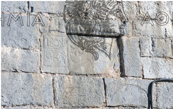
Λιθανάγλυφη χρονολογημένη επιγραφή σε εκκλησία

Αύγουστο και ερχόμασταν πάλι τέτοια εποχή, τέλη Οκτώβρη για να σπείρουμε. Αναλόγως τη δουλειά. Εγώ πήγα το '54 σε ένα χωριό εδώ κάτω στα Τριπόταμα. Κάναμε ένα δημοτικό σχολείο σε ένα χωριό, Ποροκίό λέγεται. Δεν υπήρχε δημοσιότητα τότε και πηγαίναμε με τα ζώα. Ήρθαμε εδώ τον Αλωνάρη, τον θεριστή που λέγαμε, τον Ιούλιο για να θερίσουμε, να αλωνίσουμε, βάλουμε τα σιτηρά μέσα, άχυρα για τα ζώα, κάναμε ξύλα, έλατα για να ξεχειμωνιάσουμε. Φύγαμε εκείνη τη χρονιά πριν της Παναγίας, στις 5 Αυγούστου πάλι για τα Τριπόταμα, Λάμπεια λέγεται και μεγάλη Δίβρη και καβαλήκαμε το βουνό και πήγαμε σ' ένα χωριό Τσίπιανα το λέγανε είχε πάρει ένα σπίτι ο πατέρας μου. Μετά κατεβαίνομε στο Κακοτάρι είναι ένα μοναστήρι της Παναγίας. Φτιάξαμε εκεί έναν ξενώνα και μετά κατεβήκαμε στο Ανδρώνι όλα αυτά στο Ν. Ηλείας και ήρθαμε πάλι εδώ να σπείρουμε. Σεπτέμβρη-Οκτώβρη φύγαμε πάλι για ένα χωριό στον Αάλα, Τάριζα το λέγαν τότε τώρα Αχλαδινή. Το χωριό αυτό δεν είχε νερό και πήγαμε ένα μουλάρι από εδώ για να κουβαλάμε το νερό. Γυρίσαμε πριν τα Χριστούγεννα και ξαναφύγαμε την άνοιξη, μετά τις απόκριες, την Καθαρά Δευτέρα που άνοιγε ο καιρός. Μιλάμε τώρα για 60 χρόνια πίσω...». (Δ.Π., Λαγκάδια 2013).