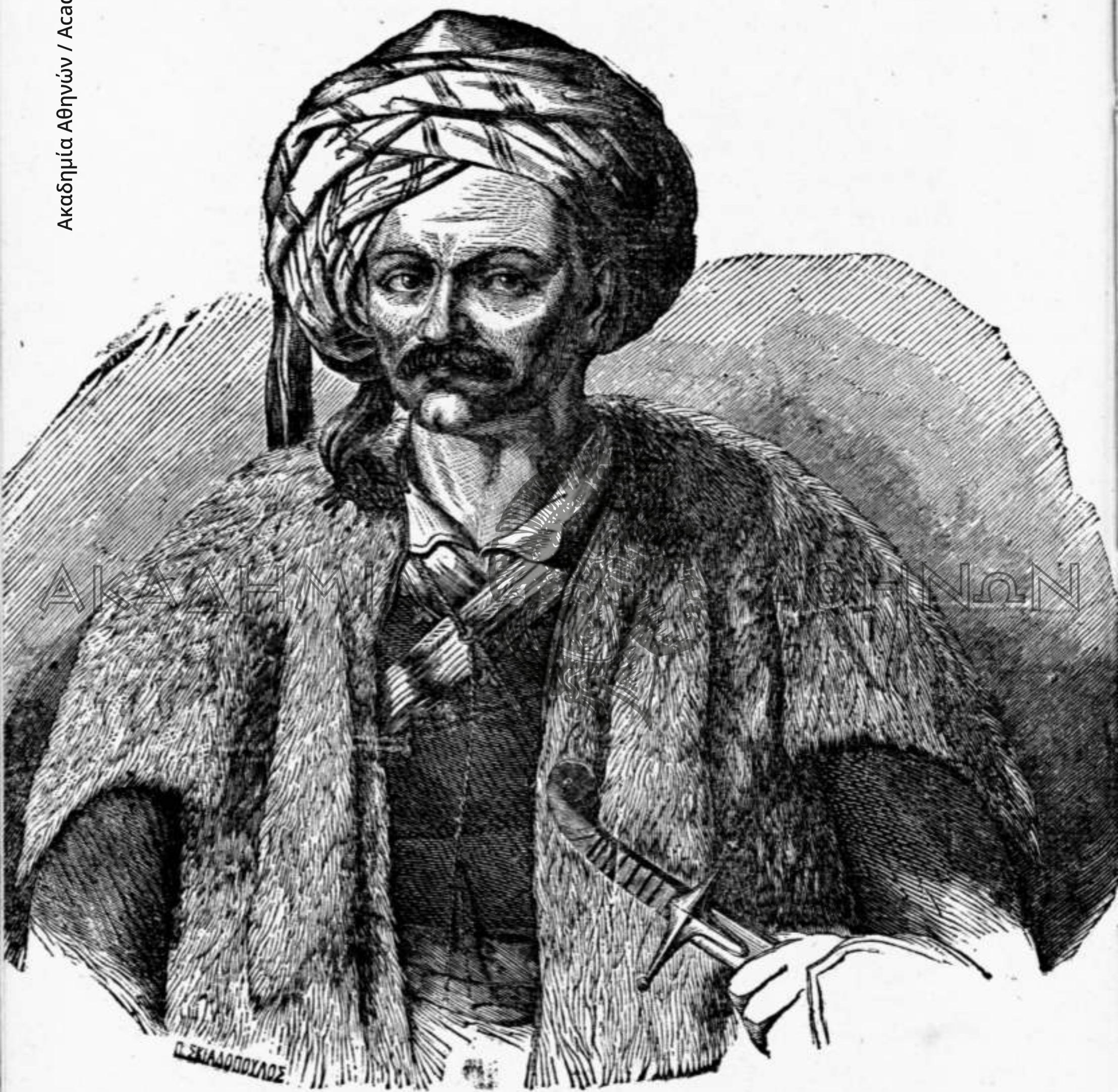
Ο ΣΤΡΑΤΗΓΟΣ ΦΑΒΙΕΡΟΣ.