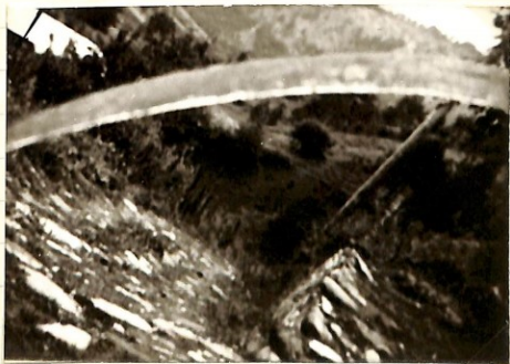
Figure 122 vs figure 121