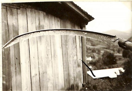
Figure 121 Kόβρα (of sickle by cutting).