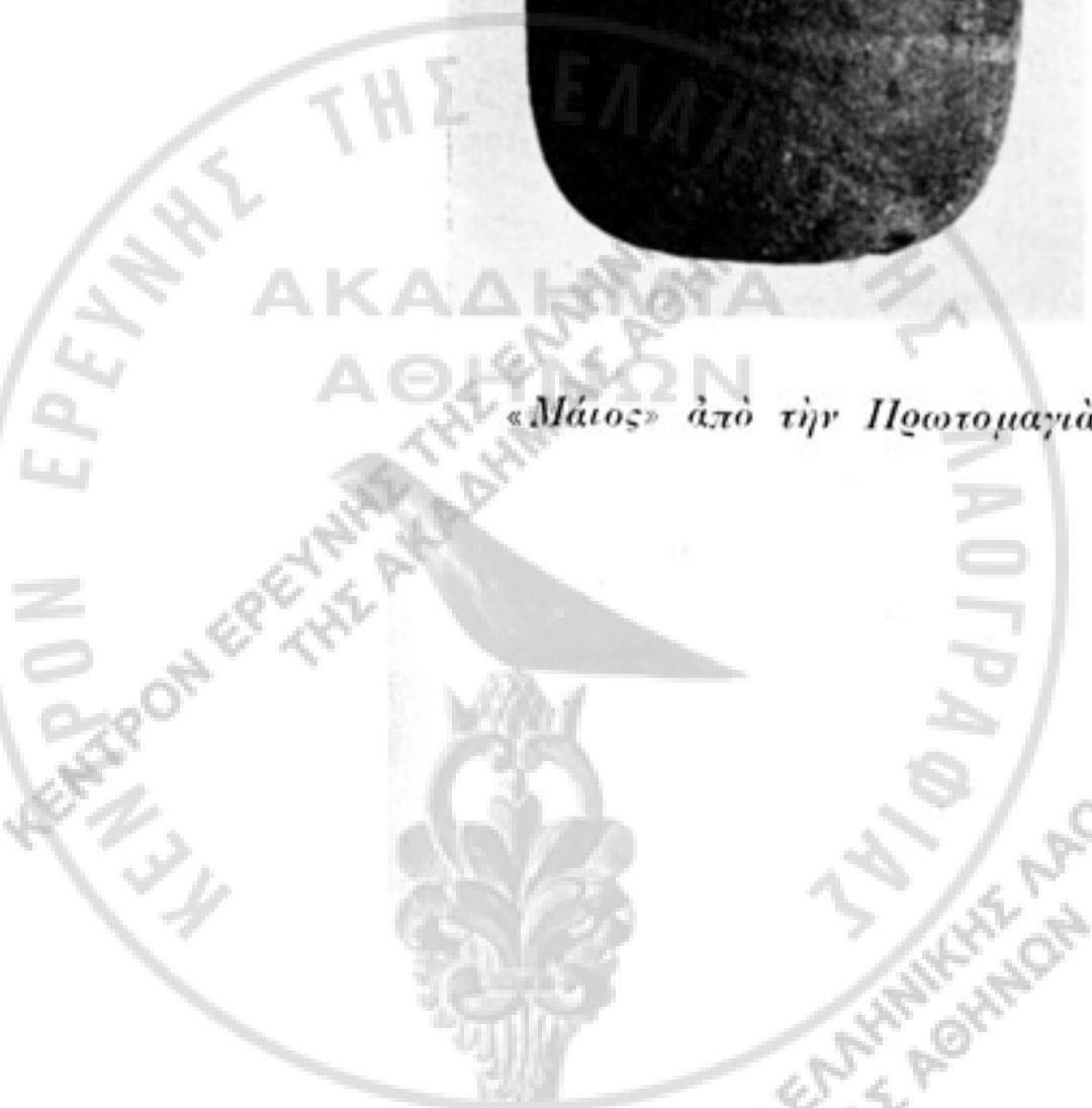
«Μάτιος» από την Προτομαγιά των γυναικῶν τῆς Μεσημβρίας (σελ. 18)

ΕΡΕΥΝΗΣ ΤΗΣ ΕΛΛΗΝΙΚΗΣ ΤΗΣ ΑΚΑΔΗΜΙΑΣ ΑΘΗΝΩΝ